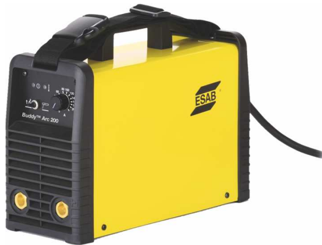
Buddy™ Arc 200