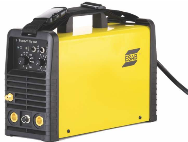
Buddy™ Tig 160